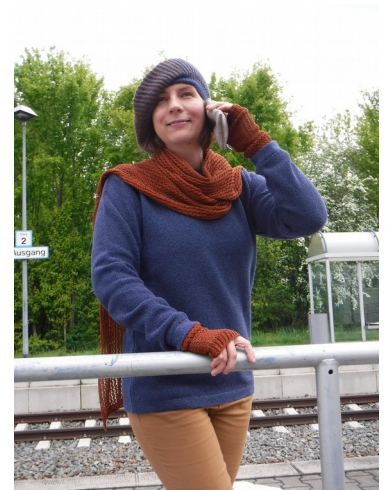
Ballonmütze, Pullover viol, Ajour- Armstulpe, Handyhülle