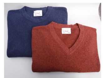
Pullover viol und fingerhut

Bitte schauen Sie auf www.wandil.de ! Sie finden dort alle Torf-Textilien mit farbigen Bildern.